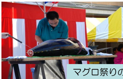
マグロ祭りの様子