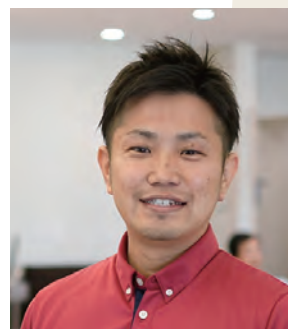
かすみケアグループ 社会福祉法人真正会 コミュニティケア部 部長

この度、社会福祉法人真正会 コミュニティケア部の部長を拝命いたしました。 社会福祉法人の在宅サービスはデイサービス4ヵ所、 ホームヘルプサービス1ヵ所、居宅介護支援事業所3ヵ所、 包括支援センター2ヵ所と川越市内広域に展開しています。 これまで主にデイサービス生活相談員・管理者として 地域の皆さまが安心して過ごせる通いの場を創ってきましたが、 現在、在宅サービスに幅広く携わることができ、大変やりがいを感じています。 新型コロナウイルス感染症の終息の見通しがなかなかつきませんが、 「新しい生活様式」の中でも、地域の高齢者の方々の健康維持や そのご家族様が安心して生活ができる【よりどころ】となれるよう、 これまで以上に精進してまいります。