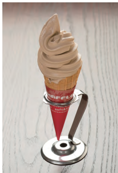
※金額はすべて税込み。

うまみがギュッと凝縮されたエスプレッソを練りこんだ、深いコクを味わえる珈琲ソフトもおすすめしたいメニューの一つです。350円