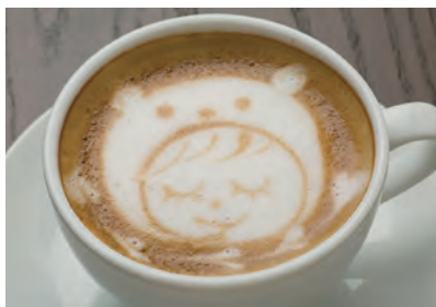
ラテアートが楽しいカフェラテ。ラテアートは霞ヶ関南病院店限定のおもてなし。380円

そして皆さまに末永く愛されるようなお店を目指して取り組んでまいりたいと思います。