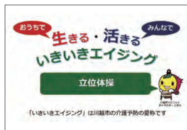
いもっこ体操の動画 ※川越市「いもっこ体操教室」のホームページより

https://www.city.kawagoe.saitama.jp/kenkofukushi/fukushikaigo/chiikihoukatsu/yobou/hokatsuimokko.html