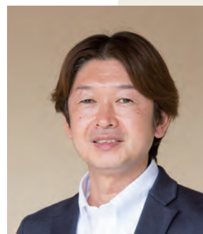
かすみケアグループ 社会福祉法人真正会 事務長

6月より社会福祉法人真正会の事務長を拝命いたしました。 私は2001年(平成13年)に地元金融機関から医療法人真正会に転職し、 2019年(平成31年)4月に社会福祉法人真正会に転籍いたしました。 社会福祉法人にきてからまだ1年程度ですので、毎日が新鮮で、 勉強の日々が続いていますが、 歴史あるこの法人で勤務することに誇りを持ち、 入居・利用される皆さまにとって安心安全に過ごせるような 施設運営に精一杯務めさせていただきますので、 どうぞよろしく願いいたします。