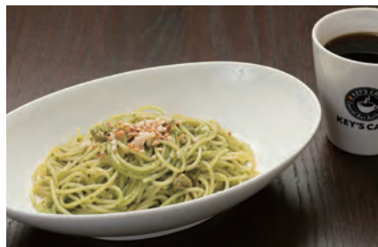
香り豊かな国産バジルのジェノベーゼ 500円*

六本木アモンド監修の Pasta や、素材にこだわった中村屋のスープなども取りそろえております。中でもフルーツ盛りだくさんのベリーパンケーキが一番の人気商品になっています。