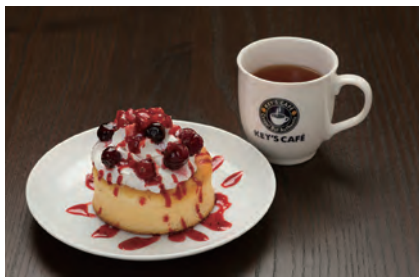
スフレパンケーキ ミックスベリー 480円*