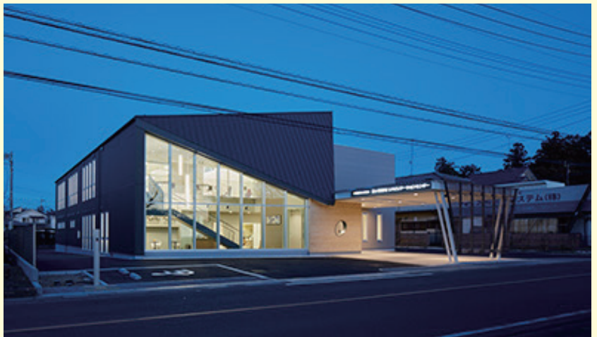
霞ヶ関在宅リハビリテーションセンター 外観