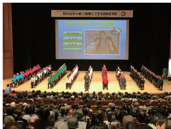
自主グループの活動を紹介（次はうちのグループも、と目標に）

ウェスタ川越の満員の大ホールで、介護予防サポーターさんや、自主グループに参加する市民の皆さんが、堂々と自分達の取組みを自慢されている様子が伝わります。