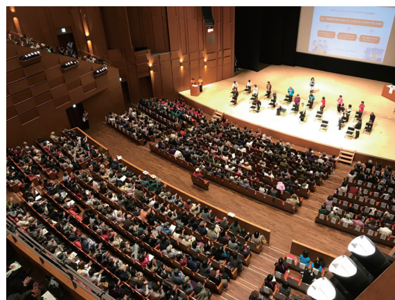
満員の会場全体と一緒に「いもっこ体操」

市民と共に、市役所・地域包括支援センター、市内の協力医療機関そして我々サポートセンターが協力して創り上げる市民のためのイベントです。毎年、多くの方に楽しみにしてもらえるような機会として続けながら、元気で暮らせるまち川越を応援していきたいと思っています。